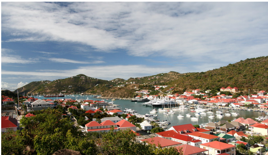
Den skyddade hamnen på Gustavia, St. Bart