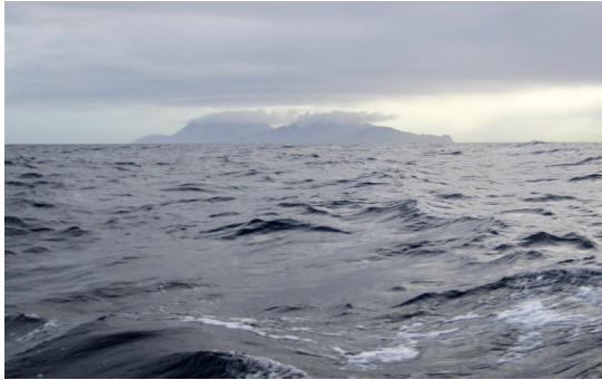
Molnen hänger tungt över Montserrat

Vårt långa stopp på Martinique i januari hade gjort att vi låg efter i vår tidsplan så nu fick vi segla förbi flera öar; Antigua, Barbuda, Montserrat, Nevis, St. Kitt, Statia och Saba. Alla hade vi säkert inte stannat vid men ett par hade vi velat besöka, framförallt Montserrat. Dit hade vi definitivt gått om vulkanvarnaren hade sagt ok till besök.