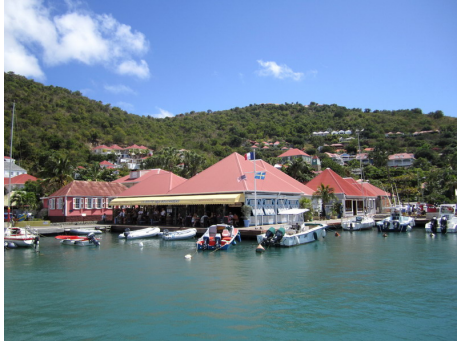
Trevlig restaurang som flaggade svenskt

Här och där ser man gator med svenskklingande namn och vi hittade en bar som tagit till sig det svenska ordentligt. Sveriges konsulat är inrymt i ett hus som uppfördes under 1820-talet och som har byggts med Göteborgs landshövdingehus som modell.