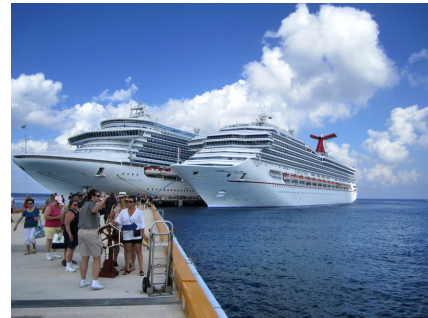
Dags att gå ombord på lite större båt!