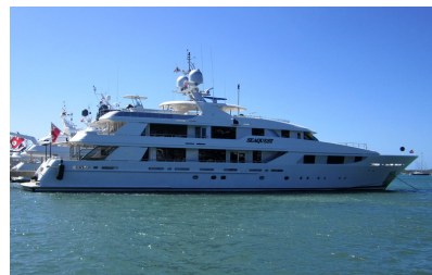
Hon har inte mycket gemensamt med vår seaQwest men bär samma namn!

När kapten kom tillbaka flyttade vi åter ut på ankring. Nu till den västligaste delen av lagunen, där det är mycket lugnare och vattnet är mycket klarare. Blåsväder gör att vi avvaktar ett par dagar med avfärd. Det blev det till att bunkra färdigt och göra båten klar för segling, för nu är det dags att lämna Simpson Bay Lagoon och Sint Maarten/Saint Martin. Nya platser väntar; BVI, Bahamas och USA.