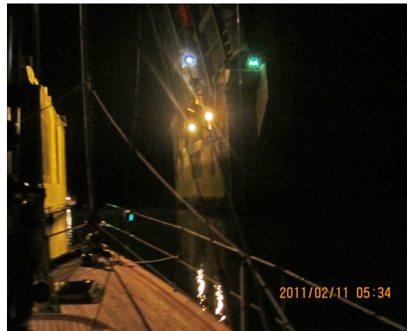
Ett par lampor på andra brofästet ledde till kolmörker

Det finns ett par broar över kanalen och dessa öppnas bara en gång per dygn. Detta infaller klockan 5.00 på morgonen så det gäller att vara morgonpigga och på plats. Vi var på plats redan tidig eftermiddag och så småningom fick vi sällskap av ytterligare två båtar. Alltså, upp med ankaret 04.45, vänta och cirkla. Ytterligare tre båtar hade anlänt så nu var vi sex. Och, på slaget klockan fem gick första klaffen upp! På rad, sakta, sakta körde vi in i den smala rännan genom mangroveträsket och letade oss fram bland röda och gröna prickar. När det är svart här är det verkligen kolsvart!