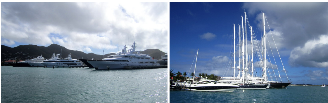
Jetsetens leksaker, en av dem heter till och med "One more toy"

Simpson Bay Lagoon är en helt sjuk värld! Här ligger båtar stora som radhuslängor på rad längs marinorna. Alla anpassade till maxmålet för bron, dvs. max 17 m breda och inte med större djupgående än 6 meter! Och på alla dessa fartyg sitter folk och putsar. All tänkbar service finns förstås och ön är skattefri så priserna är utmärkta för den som skall utrusta båt och proviantera.