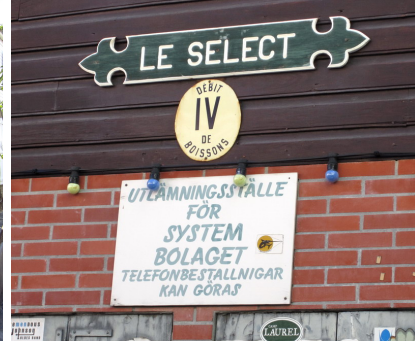
Pub som satsat på svenska skyltar

Tillbaka till Sint Maarten och Simpson Bay Lagoon, nu för att släppa av våra gäster som hunnit skaffa sig en fin solbränna under veckan som gått. Förhoppningsvis bär de med sig lite fina minnen hem till vinterlandet Sverige från våra varma, lata dagar med snorkling, bad, sol och upplevelser.