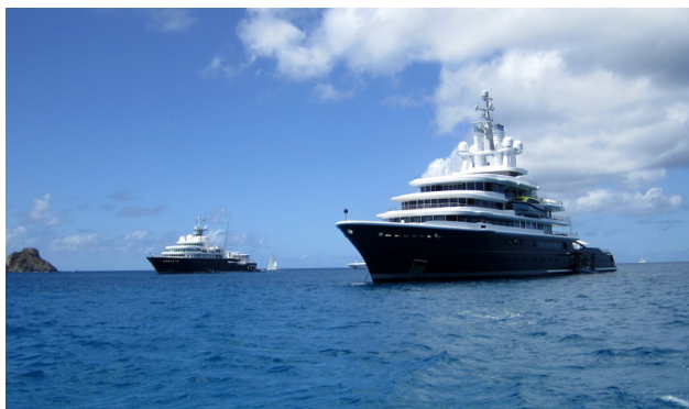
Privata båtar, ca 400 fot. Den bortre har en 50-fots segelbåt stående på däck.

Vi seglade ner till St. Barthelemy eller St. Bart som man säger i dagligt tal. Ön har varit svensk då fransmännen år 1784 skänkte den till Sverige mot att få fri lejd in till Göteborgs hamn. Man hade problem med torra så Sverige gjorde ön till ett frihandelsområde istället för att satsa på odling. Tanken med det var att Sverige skulle kunna leverera slavar till de franska öarna. Efter nästan hundra år sålde Sverige tillbaka ön till Frankrike för 300 000 riksdaler. Än idag är största delen av befolkningen vit och här samlas nu världens jetset.